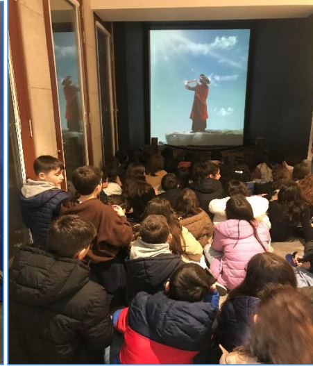
Museu "World of Discoveries"