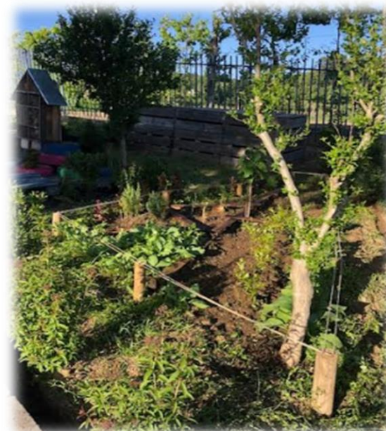
Figura 1: Guilda