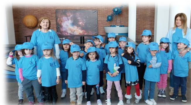
Figura 9: Planetário do Porto