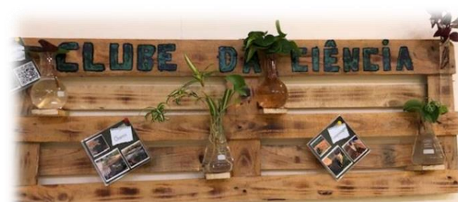
Figura 3: Biofilia