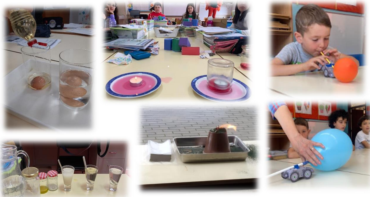
Figura 7: Workshops de Ciência