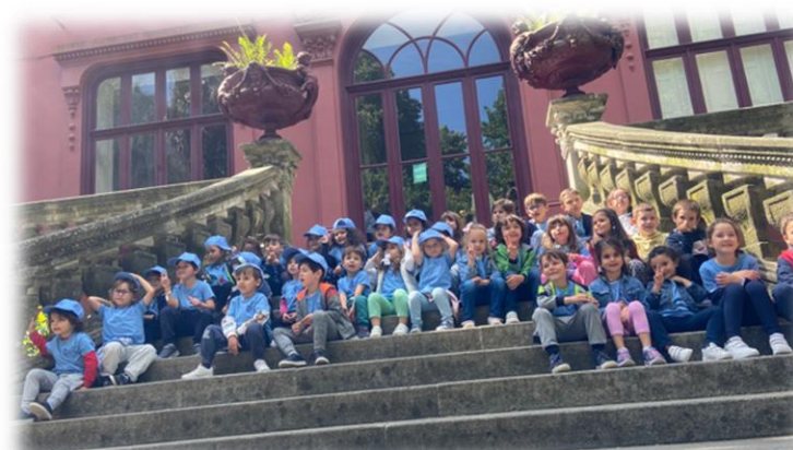
Figura 8: Galeria da Biodiversidade