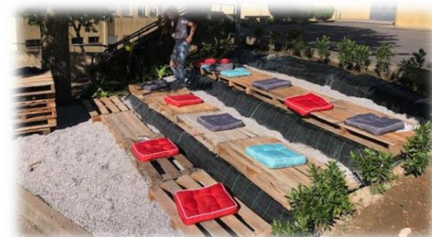
Figura 6: Anfiteatro