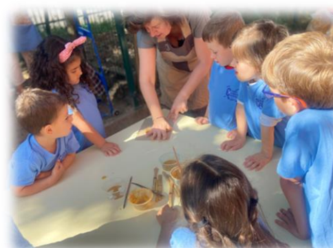
Figura 5: Workshops e Artes