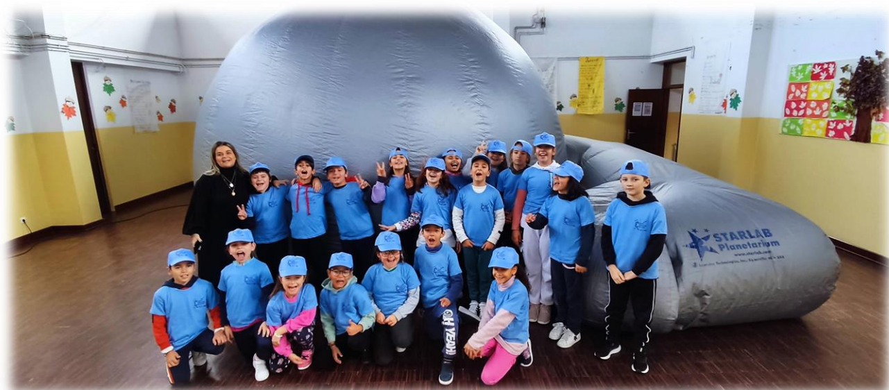
Figura 4: Dia da Astronomia